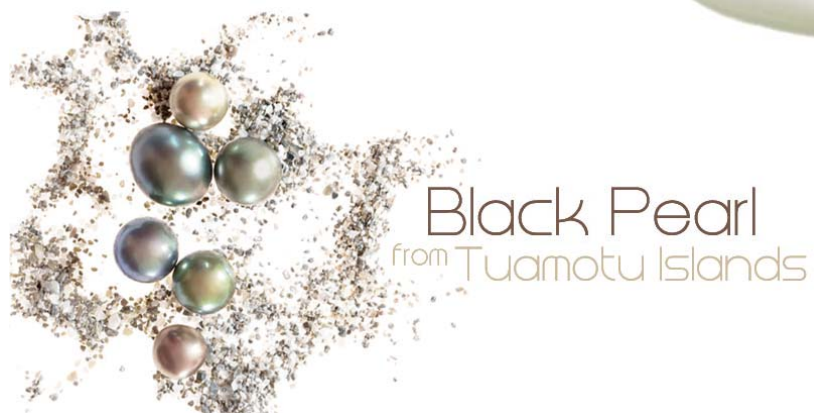
Black Pearl from Tuamotu Islands