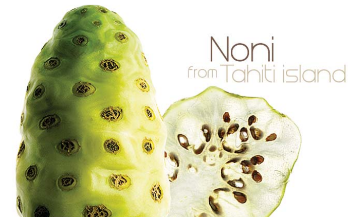
Noni from Tahiti island