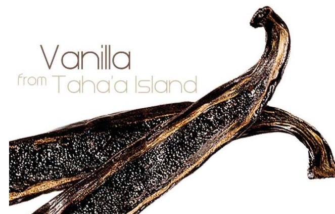
Vanilla from Taha'a Island