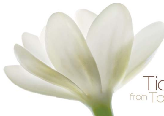
Tiare from Tahiti island