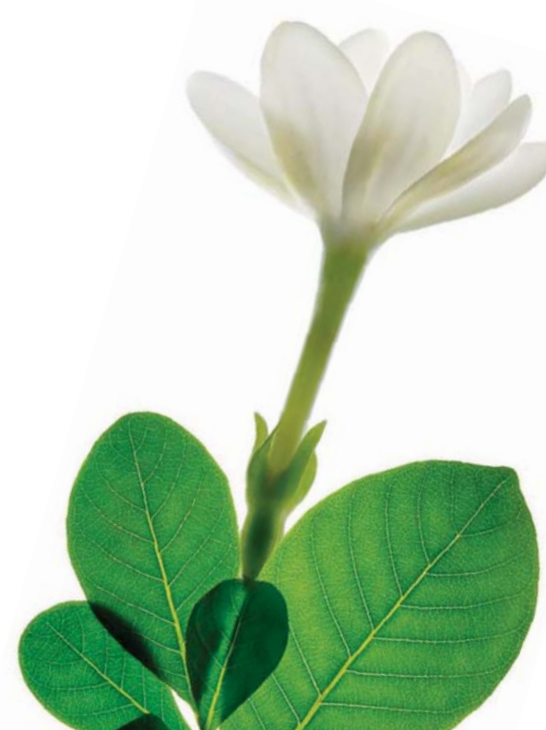
Tiare from Tahiti island

Pacifique Sud Ingredients offre molto più di principi attivi naturali